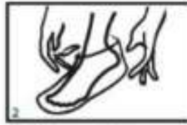
2 Nataknite nogavici na noge.