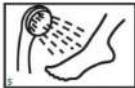
5 Po 90 minutah odstranite vrečko in sperite z vodo.