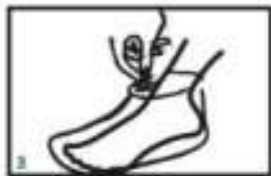
3 Stisnite nogavice z nedejo na lepša. Prilagodite tako, da vasi ne bo tiščala.