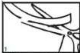
1 Odrežite po označeni liniji.