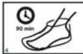
4 Pustite delovati 90 minut. Priporočamo, da si za boljše oprijem in lažje premikanje po prostoru, čez obujete bombažne nogavice.